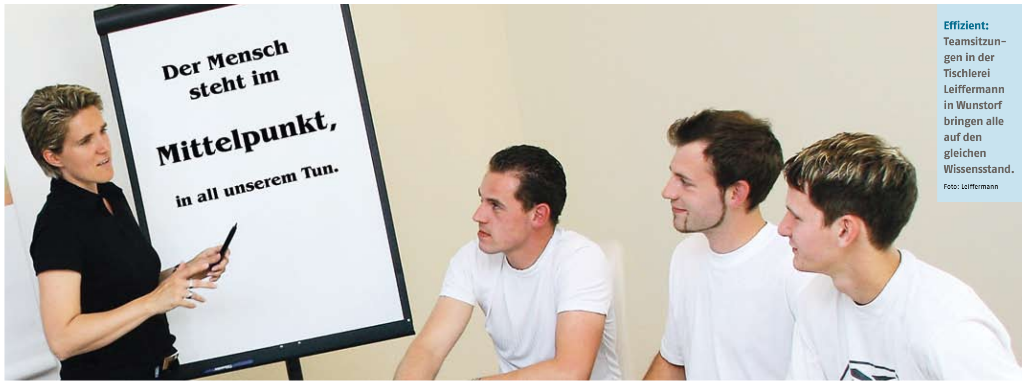
Effizient: Teamsitzungen in der Tischlerei Leifferrmann in Wunstorf bringen alle auf den gleichen Wissensstand.