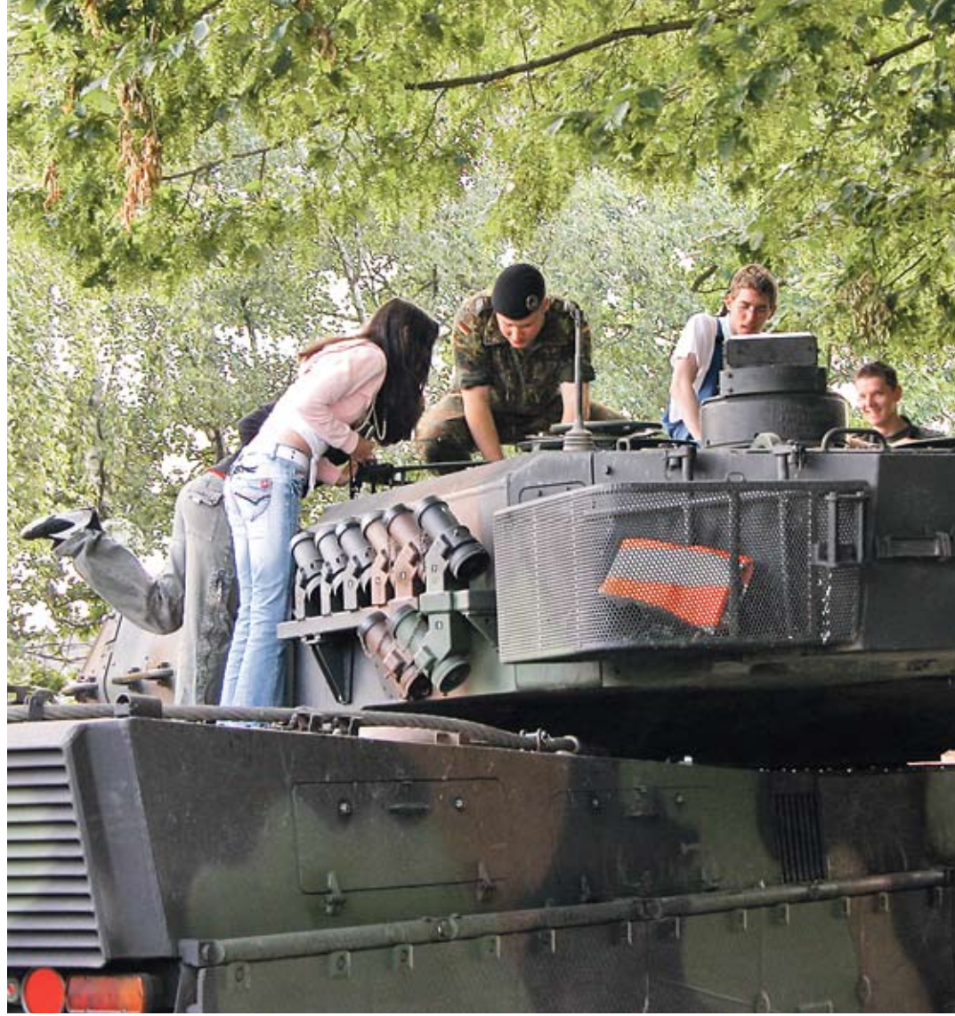
Bundeswehr: Bietet Aus- und Weiterbildung in Handwerksberufen.

Am 22. Oktober 2009 präsentieren sich rund 100 Weiterbildungsanbieter und potentielle Arbeitgeber auf der Job- und Weiterbildungsbörse 2009.